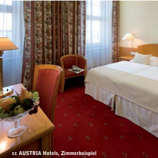
cc AUSTRIA Hotels, Zimmerbeispiel